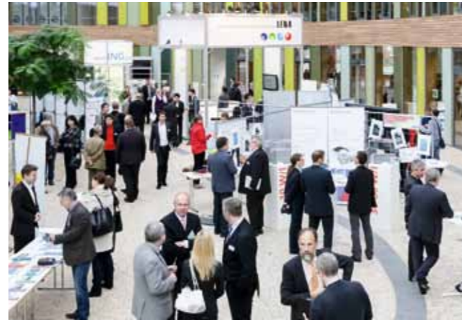
Technologieschau im Rahmen des 1. Energieforums Sachsen-Anhalt, Umweltbundesamt Dessau-Roßlau

Konkrete Maßnahmen, wie die Einführung und effiziente Nutzung von Energiemanagementsystemen, die Darstellung von beispielhaften energieeffizienzsteigernden Maßnahmen und die Begleitung bei der Förderungen auf Geber- und Nehmerseite gehören zu den Tätigkeiten der LENA. Getreu dem Motto: „ Projekte unterstützen und Akteure zur Nachahmung animieren“.